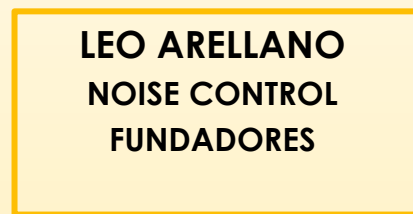
LEO ARELLANO NOISE CONTROL FUNDADORES