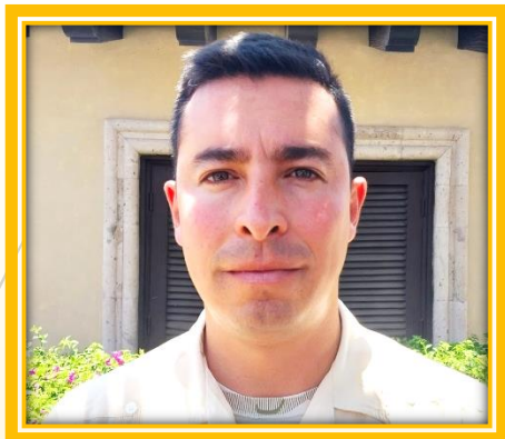
GUILLERMO GARCIA MAIN GATE