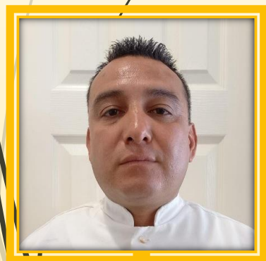
JUAN MORENO MAIN GATE